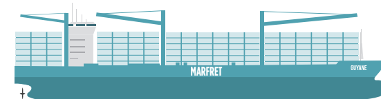
PORTE-CONTENEUR TYPE MARFRET GUYANE 2200 TEUS